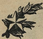
ПЛОТНИКОВ ПАВЕЛ АРТЕМЬЕВИЧ