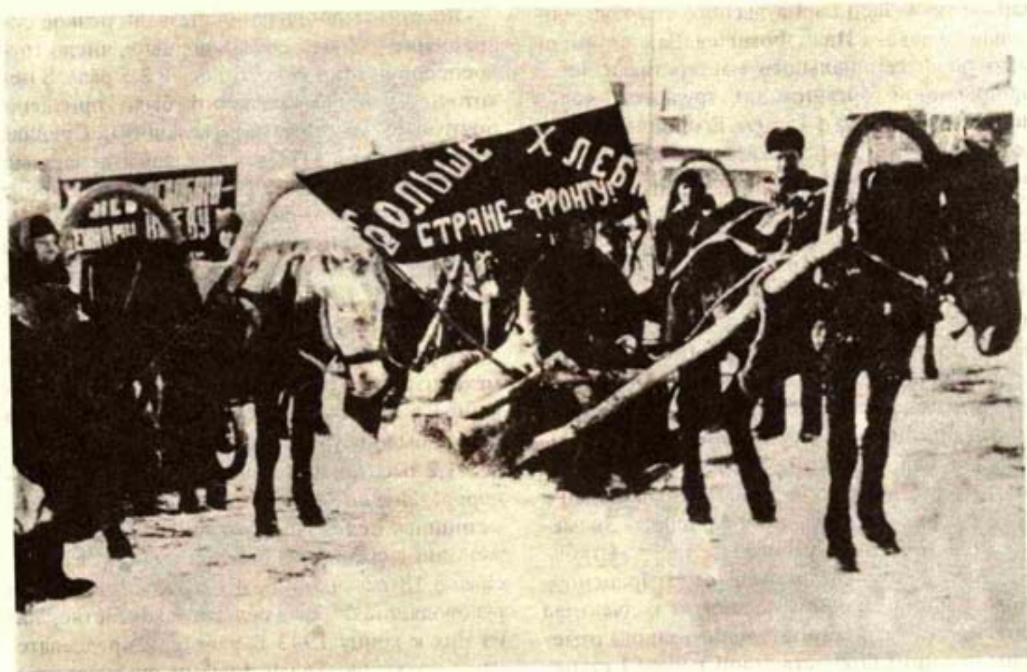
Колхозники Алейского района везут хлеб государству, 1942 год

патриотизма: массовые воскресники, движение двухсотников, тысячников, за совмещение профессий, за создание особого фонда Главного командования Красной Армии, соревнования за овладение смежными профессиями.