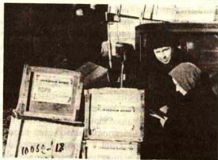
Подарки бойцам на фронт от трудящихся Барнаула, 1944 год

В военные годы многие врачи и медсестры края были мобилизованы в армию. Материально-бытовые условия жизни местного населения резко ухудшились. К тому же Алтай