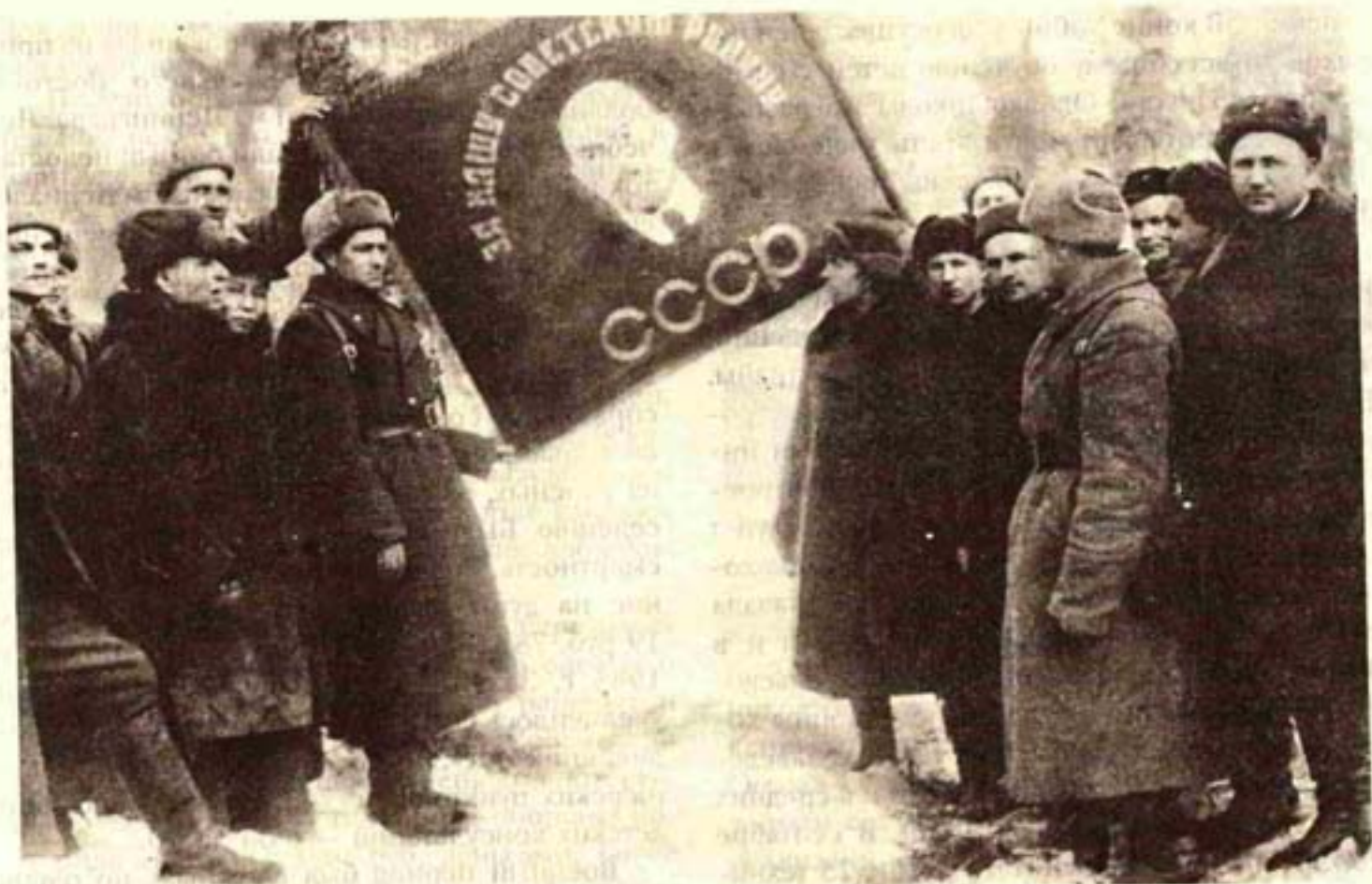
Делегация с Алтая на фронте у воинов 5-й гвардейской дивизии, 1943 год

зы и совхозы края собрали в 1942 г. меньше половины объемов зерна от довоенного уровня. Самым тяжелым оказался 1943 год: произошло сокращение посевных площадей, снизился валовой сбор зерна, план хлебозаготовок оказался сорванным, большой урон понесло и животноводство.