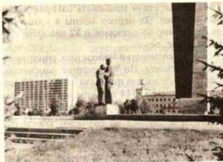
Мемориал Славы на Привокзальной площади в Барнауле