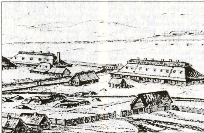
Вид завода, 1790-е

По числ. рабочих з-д в феодал. период был одним из крупнейших пр-тий не только Алтая, но и Сибири. В 1798 число мастеровых здесь составило 969, в 1830 – 1627 чел. Однако в этот период выплавка серебра сократилась с 431 до 349 пуд., что объясняется как снижением содержания металла в руде, так и архаичностью технологии. Не все мастера были непосредственно заняты выплавкой металлов. Так, по «штатам» 1849 на з-де числилось 1230 рабочих и служащих, из них на осн. операции были заняты не более 300 чел. 718 чел. работали во вспомогат. цехах: строитель-