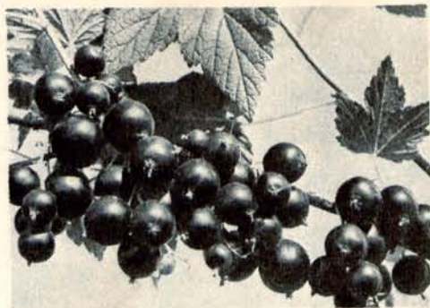
Высокопродуктивный сорт черной смородины, характеризующийся хорошими биохимическими свойствами ягод.— Диковинка.

родины Лию плодородную пыльцой дикуши. Продукт этой межвидовой гибридизации — Приморский чемпион — неоднократно был использован для выведения новых сортов. Наглядное представление об этом дает следующий пример. В 54 областях и краях СССР получил распространение сорт Голубка, выведенный М. А. Лисавенко, Н. И. Кравцовой и другими. Одним из его родителей был худяковский Приморский чемпион.